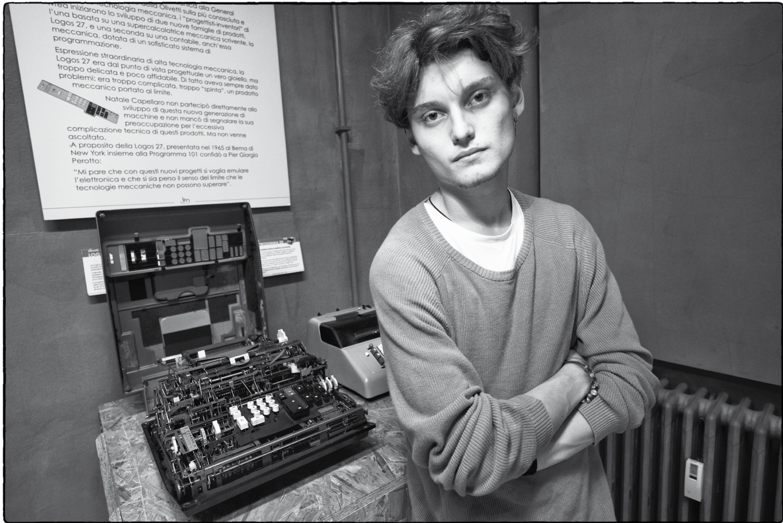
© Riccardo Lorenzi - Giuseppe Carrino - Fond. Natale Capellaro, museo Tecnicamente, Calcolatrice elettrica scrivente "Logos 27-2", 1967 - Ivrea

"La società di massa non vuole cultura, ma svago"