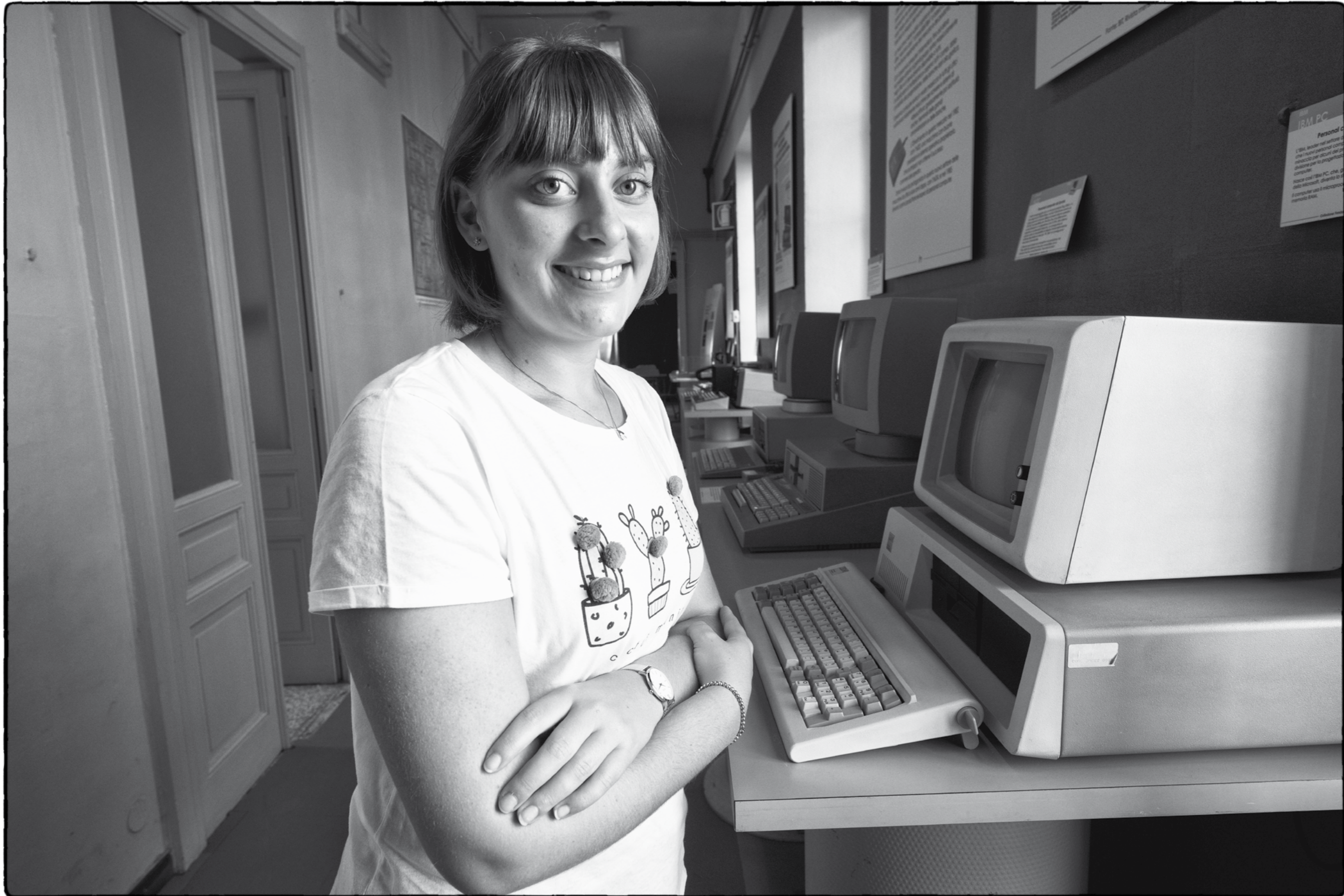
© Riccardo Lorenzi - Alice Monini - Fond. Natale Capellaro, museo Tecnologicamente - Ivrea

"La motivazione al lavoro sta nel significato di quello che si fa" Francesco Novara