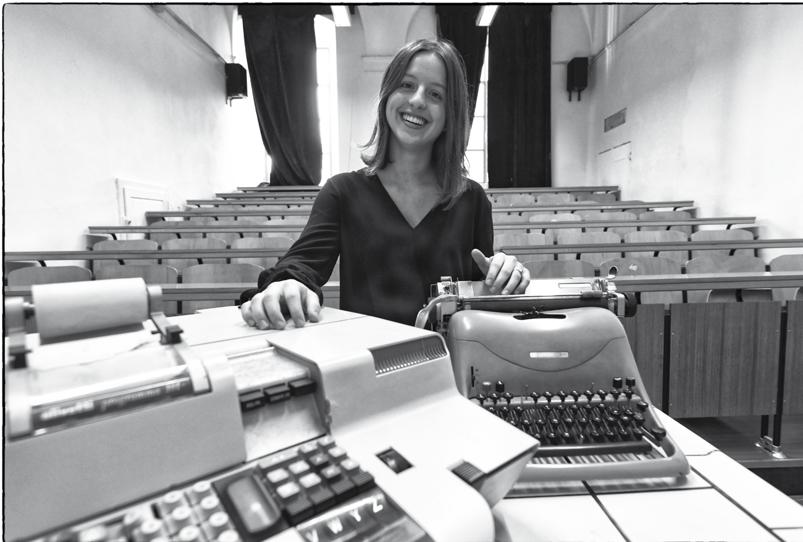
Computer Programma 101 Olivetti, 1966, Macchina da scrivere Lexikon 80 Olivetti, 1948